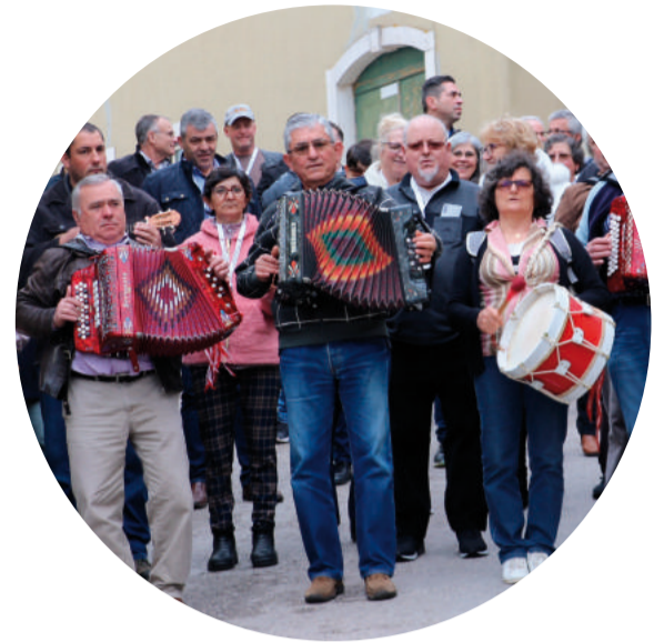
GONDEMARIA E OLIVAL