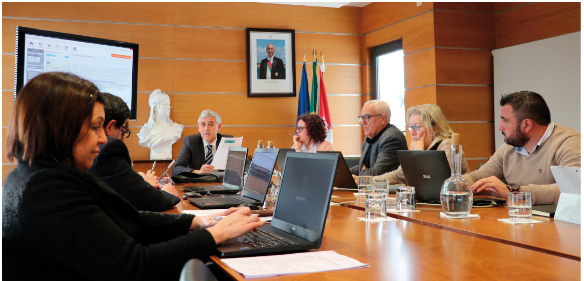
A Reunião da Câmara Municipal de 17 de fevereiro tratou temas cruciais para o futuro imediato do concelho, desde a saúde ao novo PDM de Ourém

Enquanto aguarda por respostas da tutela, avançam as obras das novas unidades de saúde de Alburitel, Olival e Sobral, estando igualmente em cima da mesa a melhoria dos serviços em Caxarias, Fátima e Rio de Coursos.