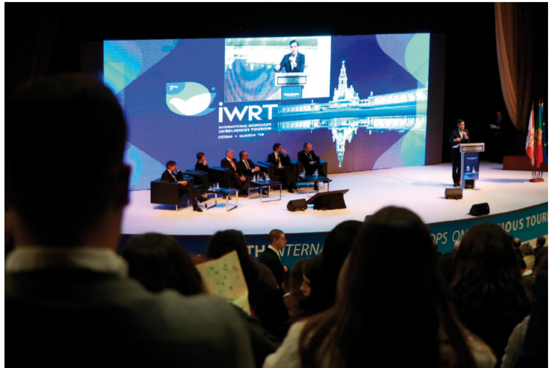
Workshop Turismo Religioso 2019

O programa dividir-se-á em quatro momentos: conferência com oradores nacionais e internacionais especializados na área, com a presença de um destino convidado; bolsa de contactos, aberta apenas a profissionais do 'trade' ('Hosted Buyers' e 'Suppliers'), com cerca de 5.000 (!) reuniões pré-agendadas; segmento de turismo de herança judaica, a decorrer a 7 de março, na Guarda; pós-tours organizados pelas Agências Regionais de Promoção Turística, exclusivos 'Hosted Buyers', dando a conhecer a multiplicidade de produtos de interesse turístico das várias regiões do país.