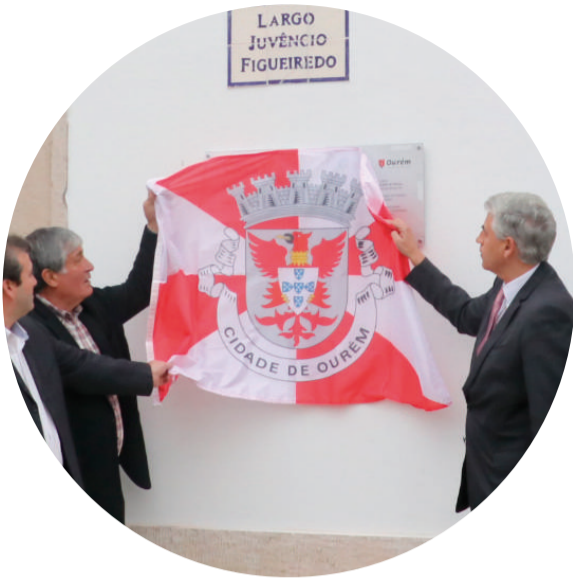
FREIXIANDA, RIBEIRA DO FÁRRIO E FORMIGAIS