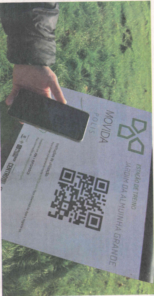
Programa Movida.Polis é uma das ferramentas disponíveis para treinar ao ar livre