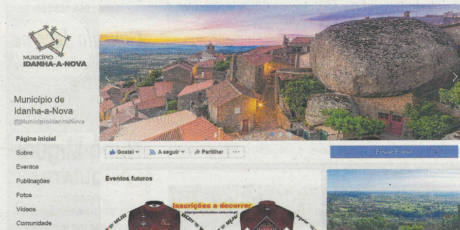
Município de Idanha-a-Nova tem apostado nas redes sociais nos últimos seis anos

A aposta nas redes sociais nos últimos seis anos, em particular no Facebook, tem disponibilizado gratuitamente um canal de comunicação aberto, dinâmico e precioso para informar e interagir com a comunidade idanhen-