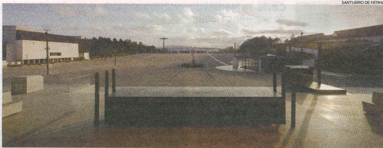
Santuário mariano quer proteger os peregrinos e evitar focos de contágio

“É com muita dor e tristeza de alma e coração, mas também com grande sentido de responsabilidade, que neste momento comunico que o Santuário de Fátima irá celebrar a grande Peregrinação Internacional Aniversária de