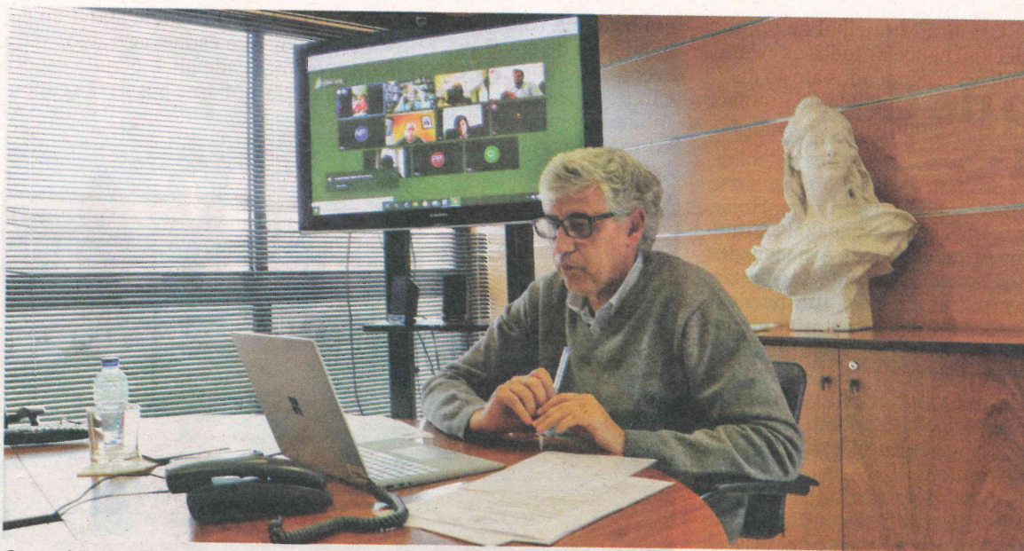
O presidente diz que este é um "sinal importante" para mostrar que há vida no concelho