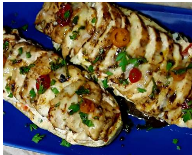
Courgette Recheada com Peito de Frango