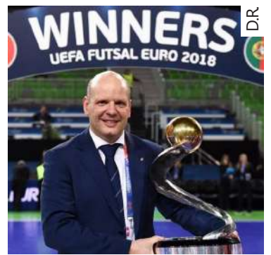
Jorge Brás é campeão da Europa

Em plena fase de conclusão da obra de requalificação do Campo do Operário, o CD Vilarense não descarta a preparação da próxima temporada. Além de já ter anunciado a identidade de alguns elementos da sua estrutura técnica, os azuis e brancos revelaram uma das principais novidades para 2020/21, através das redes sociais. "O CD Vilarense orgulha-se de anunciar que o Futebol Feminino será uma realidade a partir da próxima época", pôde ler-se, numa publicação partilhada via Facebook, na qual a direcção do clube prometeu novidades para breve. Por enquanto, ultimam-se os últimos preparativos antes da (re)inauguração do Campo do Operário, que os vilarenses pretendiam ter feito no fim de semana de Páscoa, através da edição 2020 do Torneio Bicho Carpinteiro, não fosse a pandemia de Covid-19 ter colocado o mundo em suspenso.