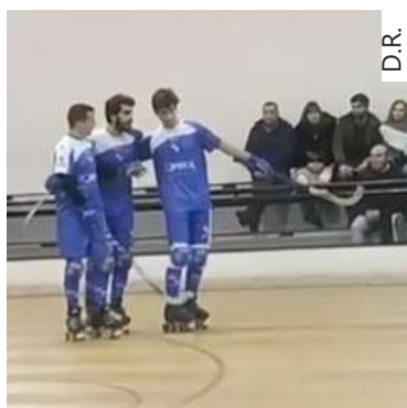
Juventude Ouriense já não rola em 2019/20

Depois de semanas de incerteza, confirmaram-se as piores suspeitas, através do cancelamento das épocas desportivas em todas as modalidades colectivas realizadas 'indoor', ou seja, jogadas em pavilhão.