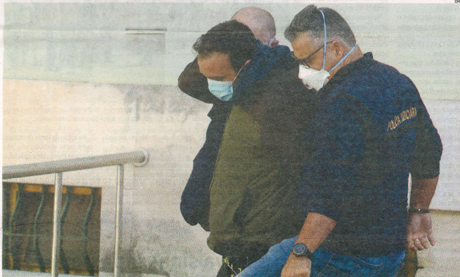
Chegada ao Tribunal de Leiria do pai da menina encontrada sem vida no domingo, em Atouguia da Baleia, Peniche. Medidas de coação para os dois suspeitos do alegado homicídio da criança são conhecidas hoje

Gabinete Económico e Social da Região de Leiria vai apresentar plano pós-pandemia Economia | P16