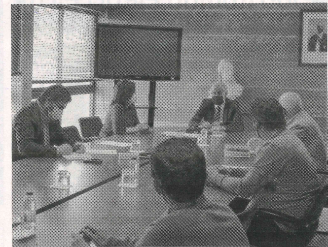
Iniciativa visa apoiar a Aciso com uma verba de 95 mil euros para acções no âmbito da ‘marca Fátima’

Deliberado pela reunião da Câmara Municipal de Ourém de 30 de Março, o documento foi assinado na passada quinta-feira, pelo presidente do município, Luís Miguel Albu-