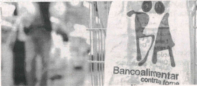
Campanha decorre até dia 31 deste mês

“Porque a ajuda não pode parar, mesmo na impossibilidade de ter voluntários nos supermercados para realizar a já tradicional campanha de recolha de alimentos durante o mês de maio, os Bancos Alimentares Contra a Fome apelam aos portugueses para que, entre 21 e 31 de Maio, contribuam fazendo os seus donativos através da Ajuda Vale nas caixas dos supermercados e/ou do portal de doação ‘online’”, destacou em