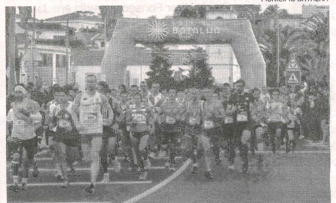
Corrida São Silvestre é uma das actividades desportivas que regista maior adesão no concelho da Batalha

“Tal serviço encontra-se prejudicado pela limitações e condicionamentos da situação de emergência nacional e mais recentemente do estado de calamidade decretado pelo Governo. Neste contexto, impõe-se a adopção de um regime de