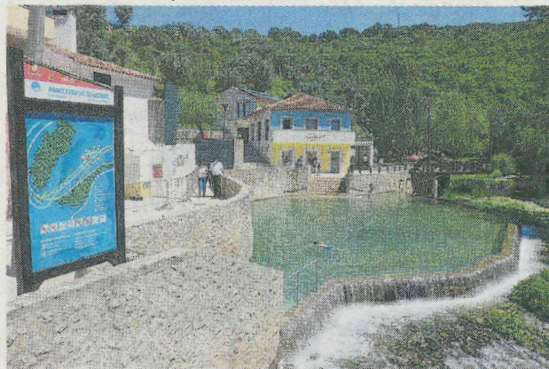
Época balnear ocorre entre 1 de julho e 15 de setembro

A época balnear 2020 na Praia Fluvial do Agroal tem início a 1 de julho e termina a 15 de setembro com várias condicionantes, de acordo com a legislação em vigor. A lotação máxima da Praia Fluvial do Agroal, definida em articulação com a Auto-