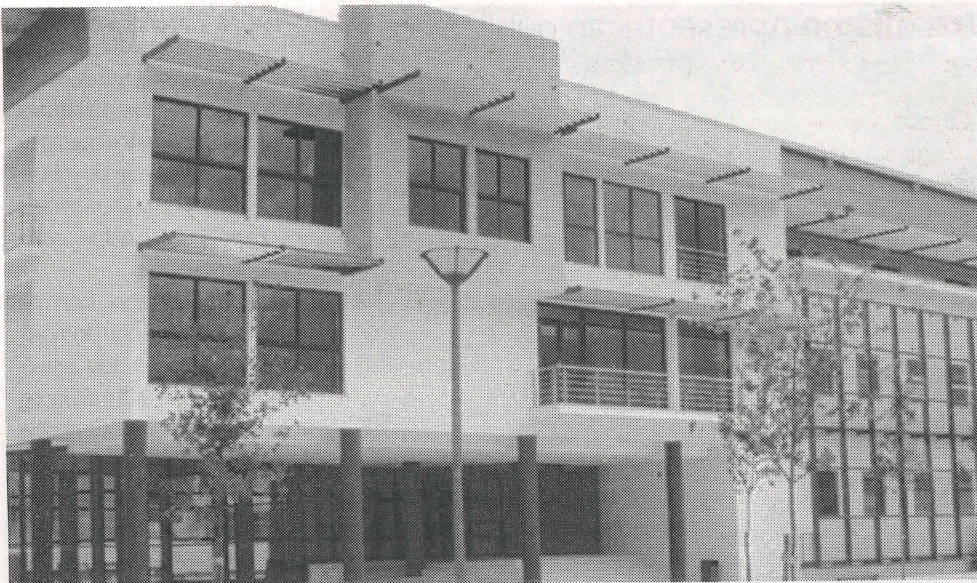
Município aprovou o relatório de contas referente a 2019, mas a dívida é de 7,5 milhões de euros

“É um valor histórico e o mais baixo desde 2002”, sublinhou.