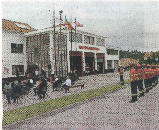
Cerimónia foi momento de evocação do papel dos bombeiros

O melhoramento dos balneários e das camaratas e a criação de uma nova sala de formação são algumas das melhorias consequentes das obras realizadas no quartel dos Bombeiros Voluntários da Freixianda, no concelho de Ourém, uma empreitada orçada em cerca de 200 mil euros e cujo resultado final foi apresentado numa cerimónia que decorreu no passado domingo.