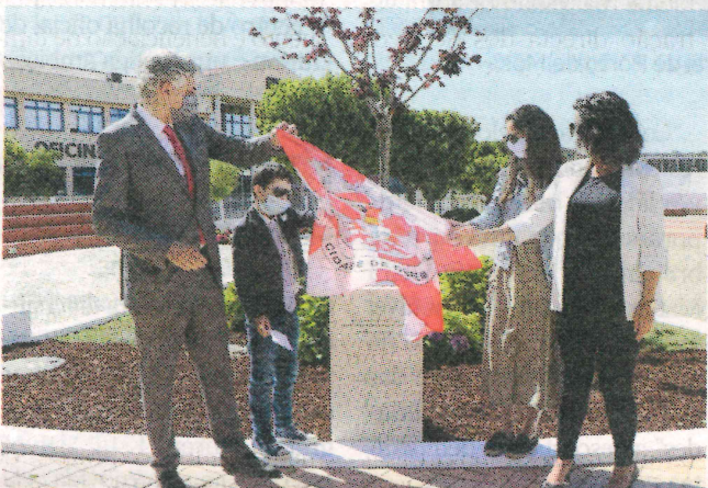
Praça Dr. Francisco Vieira foi inaugurada no sábado