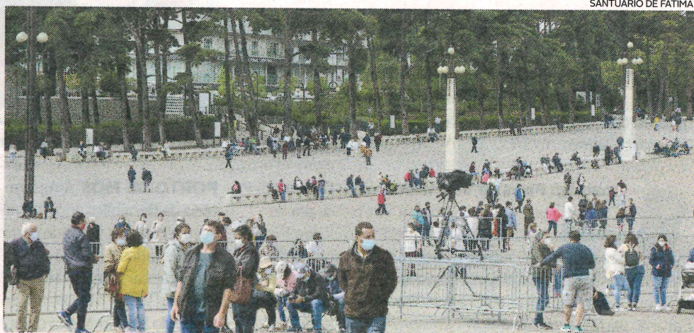
SANTUÁRIO DE FÁTIMA

Fátima Santuário confirma o registo de 16 casos com covid-19, entre colaboradores internos e externos