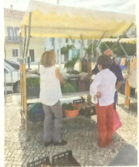
Mercado EcoRural Ourém

com o Município de Ourém, reuniram com alguns dos produtores locais (com visitas a algumas explorações), onde foi dado a conhecer o projeto “Sistema participativo de garantia dos Circuitos Curtos Agroalimentares”, e dado o interesse para os mesmos, foram debatidas algumas questões, solicitando-se o preenchimento de questionários, (Continua)