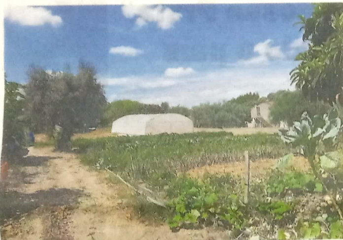
Exploração de produtos agrícolas vai ser incentivada no Ribatejo Norte

A ADIRN, com a colaboração do Município de Torres Novas e do Município de Ourém, reuniu alguns dos produtores locais, para a divulgação/participação ativa num “Sistema Participativo de Garantia” a implementar por diversos GAL's parceiros e DRAPLVT, inserido no Projeto “Parceiros para a Criação de Sistema de Certificação Participativa dos Circuitos Curtos Agroalimentares” da Rede Rural Nacional.