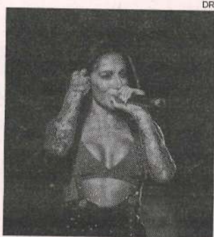
Malhoa é cabeça-de-cartaz

A Feira Nova de Santa Iria é uma feira centenária que se realiza anualmente. A Feira dispõe de diversos espaços desde espaços de carácter lúdico até espaços dedicados à restaura-