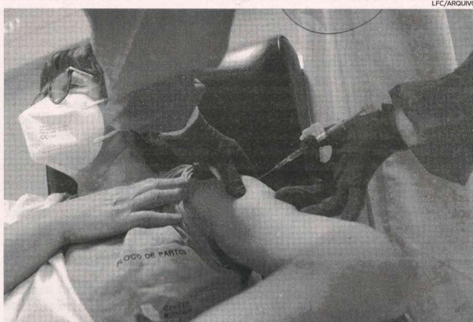
Profissionais são convocados por SMS, respeitando a ordem da vacinação da primeira dose

"Os profissionais elegíveis são convocados por mensagem escrita (SMS), respeitando a ordem da vacinação da primeira dose", refere o CHL, explicando que o seu Serviço Farmacêutico "recebeu as vacinas necessárias para todos os colaboradores, incluindo os prestadores de serviço, que já perfizeram os seis meses da