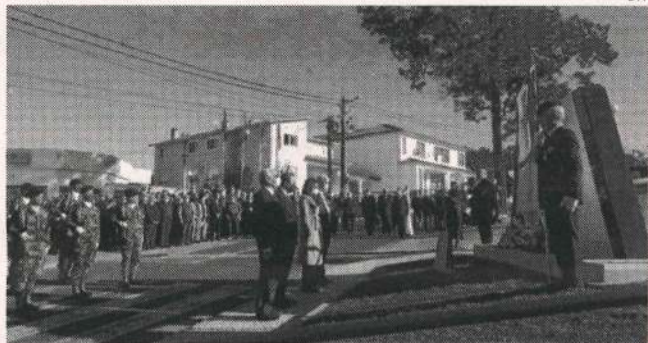
Monumento foi inaugurado no passado dia 14

HOMENAGEM A União das Freguesias de Santa Eufémia e Boa Vista, no concelho de Leiria, com a colaboração do Núcleo de Leiria da Liga dos Combatentes, inaugurou, no passado dia 14, um monumento erigido em honra dos combatentes.