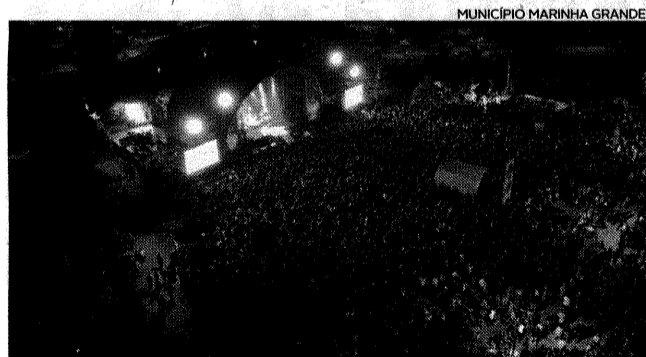
Festas da Cidade decorreram de 3 a 5 de junho

muito positivo das associações e demais entidades representadas, bem como do público que participou nas diversas ações e assistiu aos espetáculos, o que nos deixa satisfeitos e motiva para continuarmos a incremen-