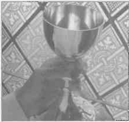
No próximo mês de Janeiro, ocorre o aniversário da ordenação sacerdotal dos seguintes sacerdotes a trabalhar

(ou a residir) na nossa Diocese de Leiria-Fátima: