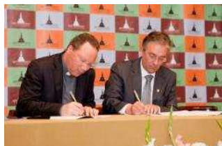
Santuário de Fátima

Protocolo assinado hoje com o Instituto Politécnico de Tomar vai permitir recorrer às mais modernas tecnologias