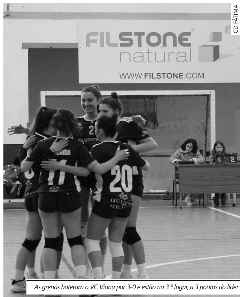
As grenás bateram o VC Viana por 3-0 e estão no 3.º lugar, a 3 pontos do líder

Depois da derrota em casa do histórico Leixões SC (3-0), a primeira em 15 jogos oficiais na temporada, o CD Fátima regressou a casa e retomou a normalidade, vencendo o VC Viana, por 3-0, após 25-20, 25-11 e 25-17 nos parciais, na 4.ª jornada da Série B do Nacional de Juvenis.