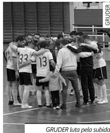
GRUDER luta pela subida

No extremo oposto, o Cercal perdeu em casa do Empregados do Comércio, desperdiçando a oportunidade de apanhar o penúltimo classificado e afundando-se no último lugar da tabela, com apenas 4 pontos somados e a 10 dos escalabitano.