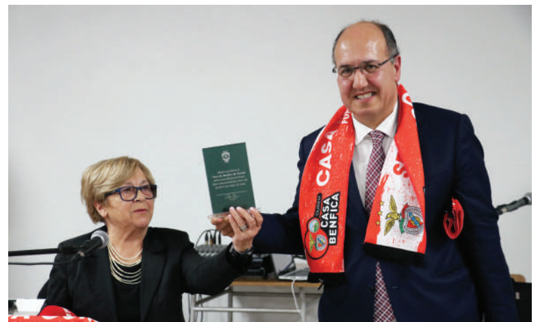
Casa do Benfica e Núcleo do Sporting numa exemplar demonstração de fair-play

largas dezenas de benfiquistas da região conviveram e homenagearam os fundadores desta associação ourense, num evento animado pela equipa de reportagem da Benfica Tv, no qual o emblema da Luz se fez representar pelo director do