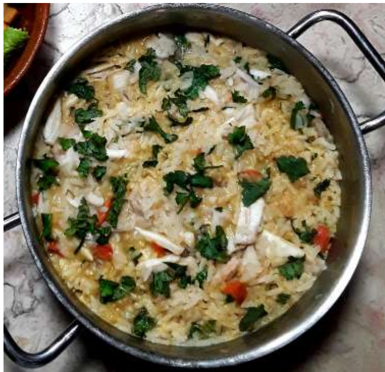
Arroz de Raia

Lavar muito bem a raia, raspando bem a pele para retirar toda a viscosidade. Num tacho, colocar a cebola, o alho, o louro e o azeite. Levar ao lume e deixar refogar um pouco. Temperar com pimenta. Depois adicionar o tomate e o pimento e deixar estes amolecer. Juntar a água e temperar com sal. Tapar para que ferva mais rapidamente e assim que ferver juntar a raia.