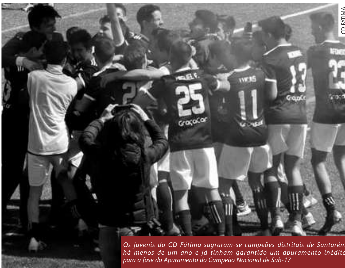
Os juvenis do CD Fátima sagraram-se campeões distritais de Santarém há menos de um ano e já tinham garantido um apuramento inédito para a fase do Apuramento do Campeão Nacional de Sub-17

Acto contínuo, não há títulos a atribuir, muito menos subidas de divisão para festejar ou descidas a lamentar. A pandemia pode ter sido suficiente para evitar tudo isto, mas nunca chegará para apagar a excelência dos resultados obtidos pelos escalões de formação do CD