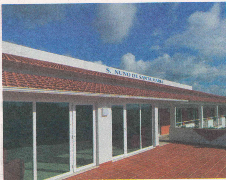
Surto em lar infetou até à data 44 pessoas

A unidade efetuou ainda um levantamento de todos os utentes que, entre os dias 1 e 17 de junho, possam ter contactado com o enfermeiro infetado, tendo procedido, em conjunto com a autoridade de saúde local, a uma avaliação do risco de exposição dos utentes. Segundo o CHL, esta “foi considerada de baixo risco, uma vez que este profissional, como todos os profissionais do CHL, respeitava a utilização dos equipamentos de proteção individual adequados”. MR