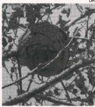
Vespa asiática pode colocar em perigo o ecossistema

todo, foram capturadas cerca de 4500 vespas e foram destruídos 106 ninhos em todo o concelho.