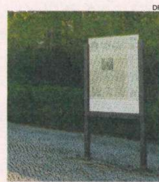
Painéis estão no recinto