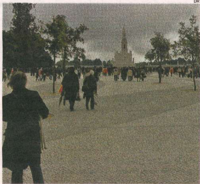
Encontros estavam agendados para o final desta semana, em Fátima

Os Encontros PNAID, que dão continuidade aos Encontros de Investidores da Diáspora, são uma iniciativa conjunta do gabinete da secretária