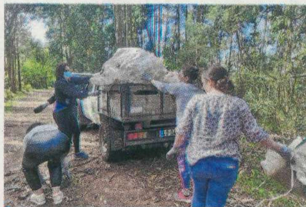
Ações de limpeza decorreram em lugares emblemáticos

A ação de limpeza culminou com cerca de meia tonelada de lixo recolhido da natureza, um contributo